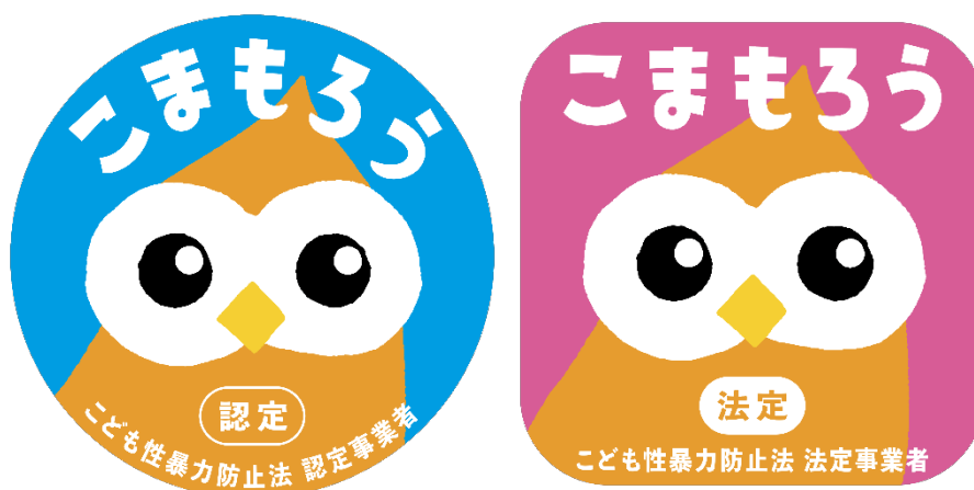
(左：認定事業者マーク、右：法定事業者マーク)